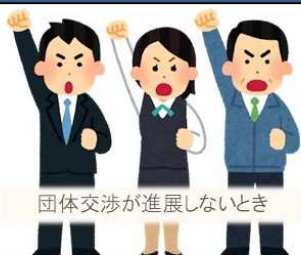
団体交渉が進展しないとき